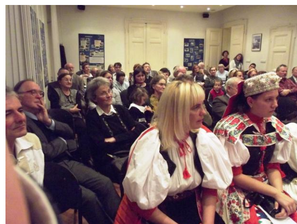
(jobbra: a közönség egy része az estünkön)